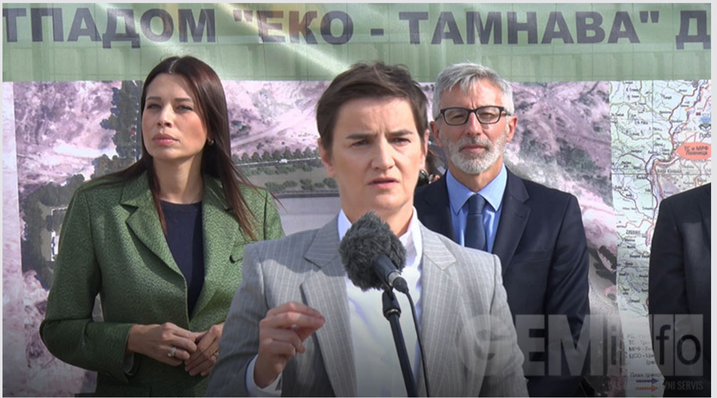
Ana Brnabić, predsednica Vlade Republike Srbije

Premijerka je zaključila da ulaganja u zaštitu životne sredine od 2014. predstavljaju najveća ulaganja u istoriji Srbije, i naglasila da je Vlada Srbije uvek otvorena za konkretne predloge i konstruktivne razgovore.