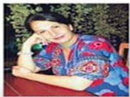
Yazarlar için zaman geliştirmek için çalışıyoruz.

I.N. Uluslararası işbirliklerimiz var. Özellikle, yazar, yönetmen değerlendiriyoruz. Her anlamda başarılıdır.