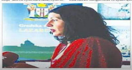
Şiirli Yönetmen Şiirli Yönetmen