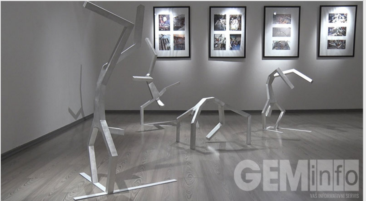
Figure oba umetnika nastajale su tokom nekoliko godina i predstavljaju samo deo opusa.

Uprsko različitosti koncepta dva umetnika, njihove suprotnosti se dopunjuju i sjedinjuju. Darko kaže da mu se više sviđaju Jasnine skulpture i da se gledajući figure svoje koleginice rasterećuje svojih konceptata.