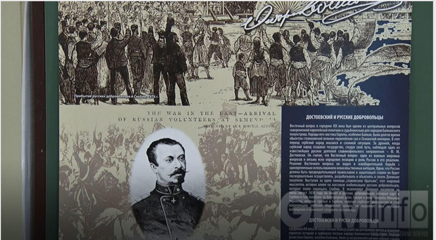
Ova izložba nastala je pre deset godina povodom stogodišnjice od smrti Tolstoja i predstavljena je u Rusiji.