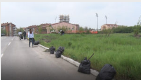
MZ Stanislav Sremčević Crni