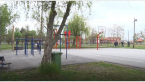
MZ Gornji Grad