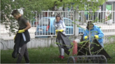
MZ Gornji Grad